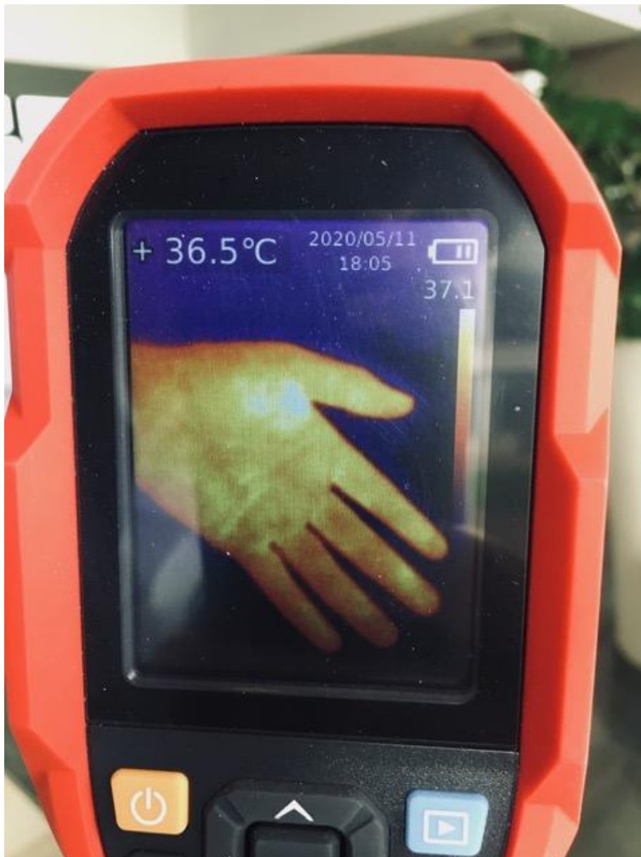
Nelle foto un test di misurazione di una mano a 36,5°C

Abbiamo optato per il termo scanner per motivi di precisione e facilità d'utilizzo. La misurazione con termometro ad infrarosso infatti, prevede l'avvicinamento individuale a pochi centimetri; col termo scanner la distanza di sicurezza può invece essere rispettata integralmente. I termometri ad infrarosso hanno inoltre un margine di errore compreso tra 0,5°C e 1,5°C gradi mentre il termo scanner ha un margine d'errore compreso tra lo 0 (zero) ed i 0,5°C: un grado di differenza è molto prezioso quando si parla di sicurezza.